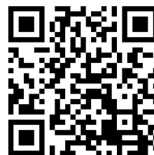
専用ホームページ QR コード

総会参加をご希望の方は、 令和 8 年 1 月 16 日（木）までに専用ホームページ ( https://va.apollon.nta.co.jp/jakushinkyō57/ ) よりお申し込み下さい ますようお願い申し上げます。