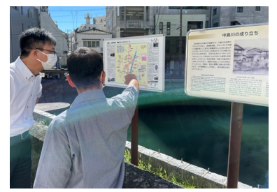
④専門家による現地調査